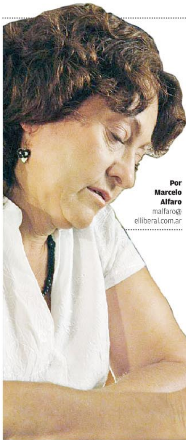
Por Marcelo Alfaro malfaro@ elliberal.com.ar

La periodista ofrece su visión acerca de uno de los personajes más emblemáticos de Tucumán, plasmada en El Sheriff, vida y leyenda del "Malevo" Ferreyra , un libro basado en una investigación que le demandó unos quince años.